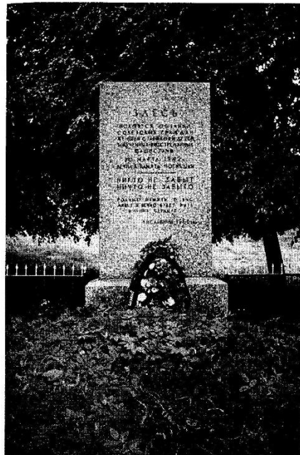
Поселок Хиславичи. Памятник на братской могиле жителей Хиславичского района еврейской национальности, расстрелянных фашистами в период оккупации